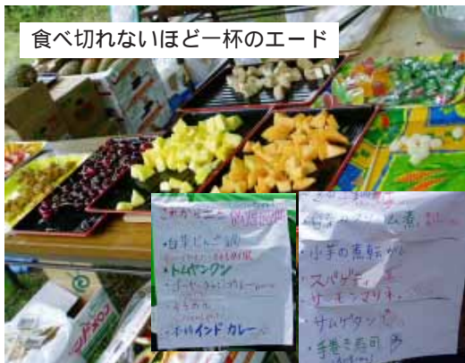
食べ切れないほど一杯のエイド