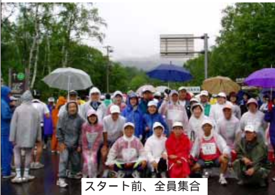
スタート前、全員集合