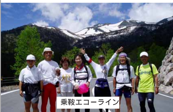
乗鞍エコーライン

6月18日(日)第8回RUN&WALK in 乗鞍高原が行われました。前日の土曜日には、三本滝駐車場から2702mの畳平まで往復30kmをジョギング、雄大な乗鞍岳や雪の壁を満喫しました。翌日のレースは乗鞍観光センターを基点とした1周12kmの雄大な大自然のネイチャー周回コースを走るもので、善五郎の滝やあざみ池、水芭蕉園、牧場、つつじ園などを通る素晴らしいコースです。12kmのコースで途中計4回通るエイドは明太子とうふ、おかゆ、さくらんぼ、そば、トムヤンクン、ソーメン、印度カレー、きのこと鍋、小芋、スパゲティ、サーモンマリネ・・・など食べきれないほどの豪華な食べ物でした。まさに日本一の大自然コース、日本一のエイドと言っても過言ではありません、お勤めの大会です。