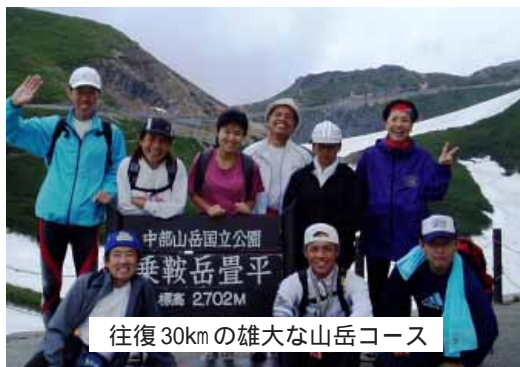
往復30kmの雄大な山岳コース