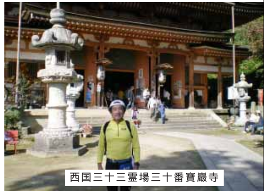
西国三十三霊場三十番寶巖寺