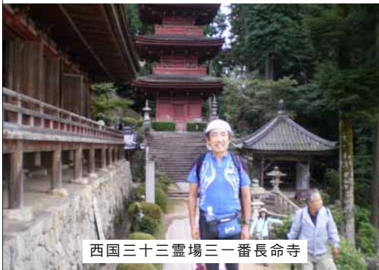
西国三十三霊場三十一番長命寺