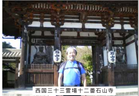
西国三十三霊場十二番石山寺