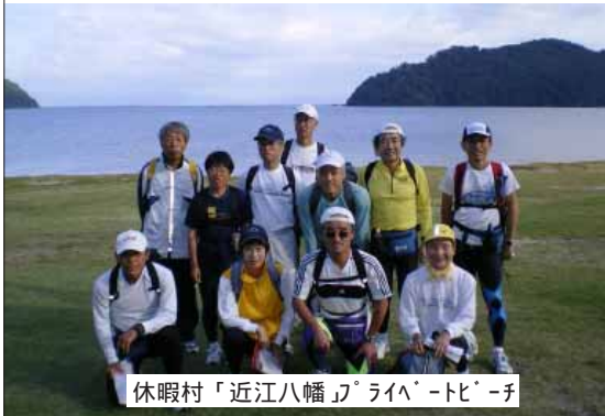
休暇村「近江八幡」ライブビーチ