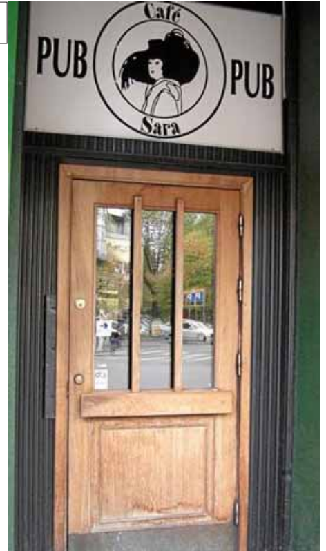
Around the corner of the hostel there is a pub/restaurant that is called Cafe Sara. They have good food for a small money.

北極圏 ミッドナイトサンマラソンと スカンジナビア3国 大自然の旅 NPO法人 きふ長良川走ろう会